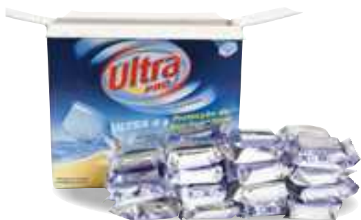
ULTRA PRO 5 em 1 com embalagem demasiado grande para a quantidade de pastilhas